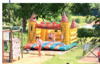
Xavier F a écrit un avis sept. 2018