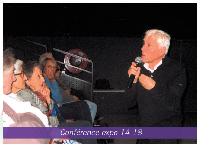
Conférence expo 14-18