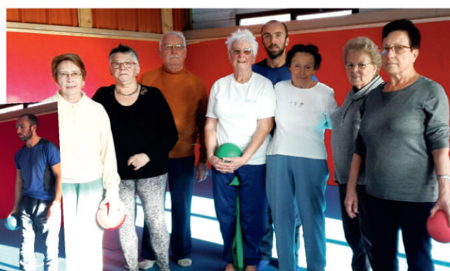
Une partie de la joyeuse équipe de sportifs !