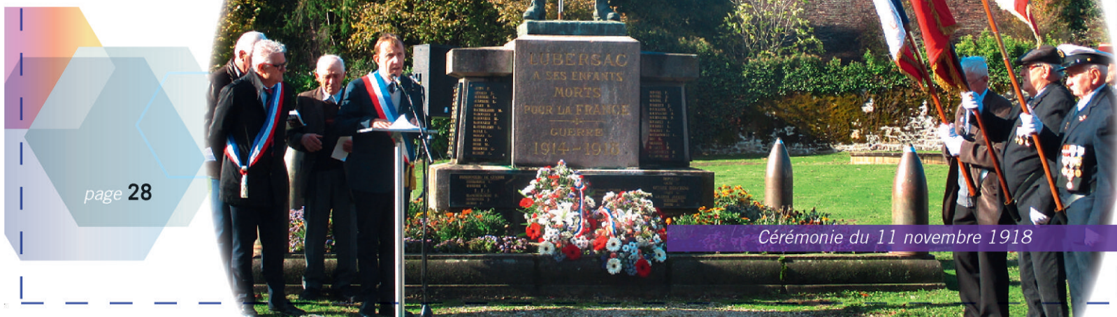
Cérémonie du 11 novembre 1918