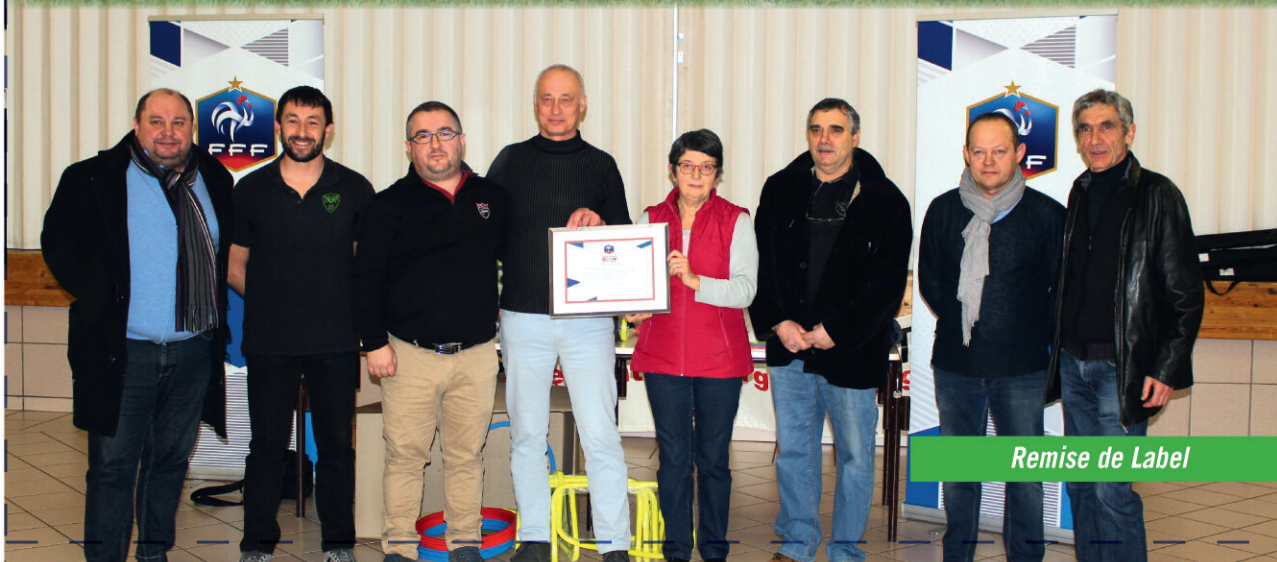
Remise de Label