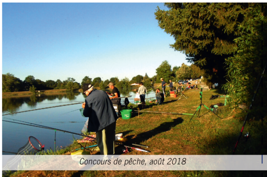
Concours de pêche, août 2018