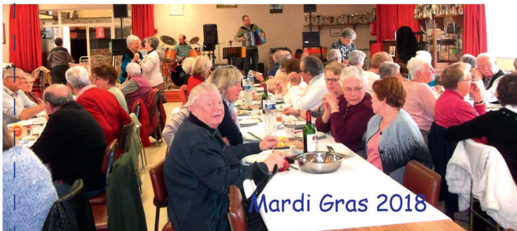
Mardi Gras 2018

Pour la saison à venir, un programme a été établi dans l'objectif d'essayer de satisfaire au mieux, les adhérents.