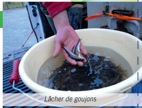
Lâcher de goujons