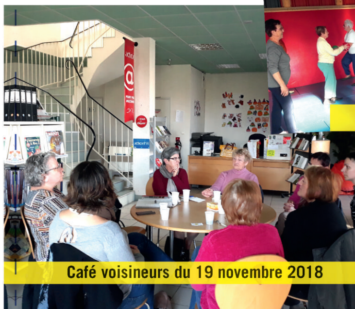
Café voisins du 19 novembre 2018