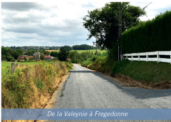
De la Valeynie à Fregedonne