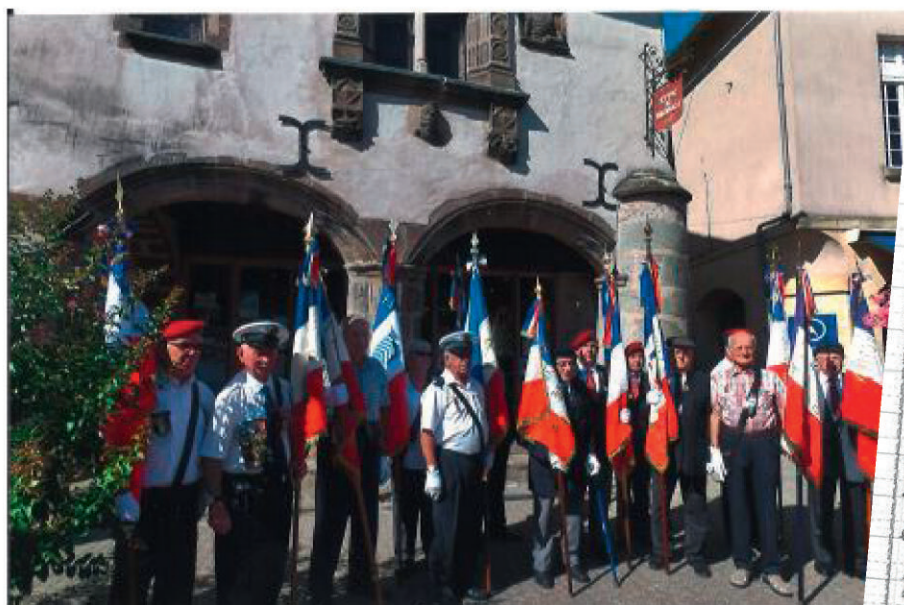
64 e anniversaire fin de la guerre d'Indochine 11 août 1954-11 août 2018