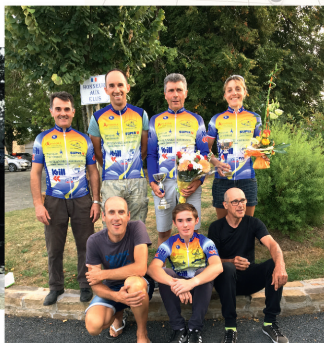
Les lubersacois sont restés aux avant-postes tout au long de la saison.