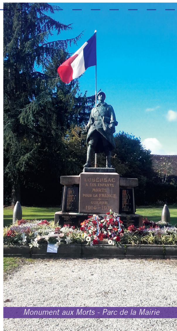
Monument aux Morts - Parc de la Mairie

Soit un total de 23 749.40 Frs (sous réserve des éléments trouvés dans les archives). Il manque, en effet, l'intervention de M. HIVERT, non chiffrée dans les délibérations (fourniture et taille du granite notamment).