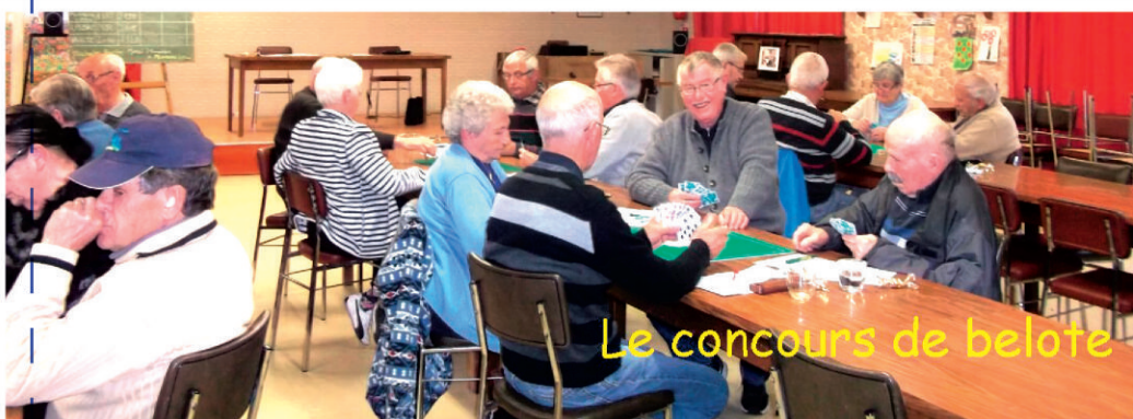
Le concours de belote