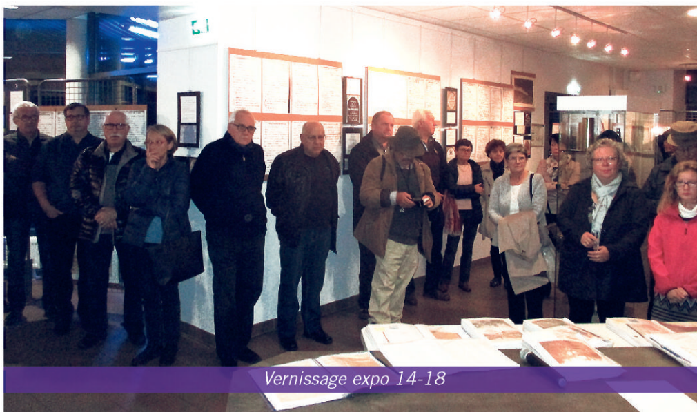
Vernissage expo 14-18