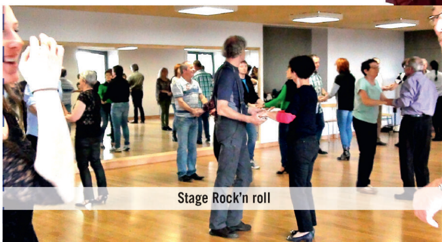
Stage Rock'n roll