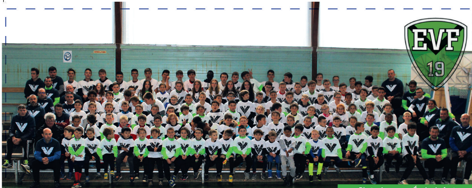
Photo de groupe École de foot

En espérant vous compter parmi nos supporters pour cette fin de saison...