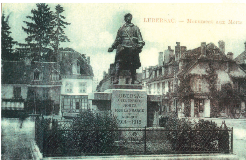
LUBERSAC — Monument aux Morts de la Grande Guerre 1914-1918

avec nos remerciements les plus sincères à l'ACPR : Association des Collectionneurs de Pompadour et de sa Région pour les cartes postales illustrant le Monument aux Morts de Lubersac